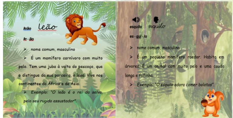
Fig. 1 – Entrada formato impresso.

Já o formato digital consistirá numa versão de realidade virtual do anterior. A visualização será de 360°, haverá um botão para ouvir a pronúncia do nome do animal, um outro que permite ouvir a respetiva onomatopeia ou som produzido pelo próprio animal, quando existente, e um botão/funcionalidade de leitura áudio, para crianças com dificuldades visuais. Tratar-se-á, assim, de um dicionário que recorre a informação multimodal, com preocupações ao nível da seleção, adequação e conteúdo informativo das imagens e sons.